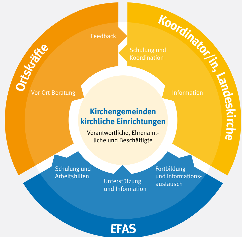
Struktur des Betreuungskonzeptes der EKD

Die Arbeit der EFAS ist Ausdruck der Wertschätzung gegenüber den kirchlichen Mitarbeitenden.