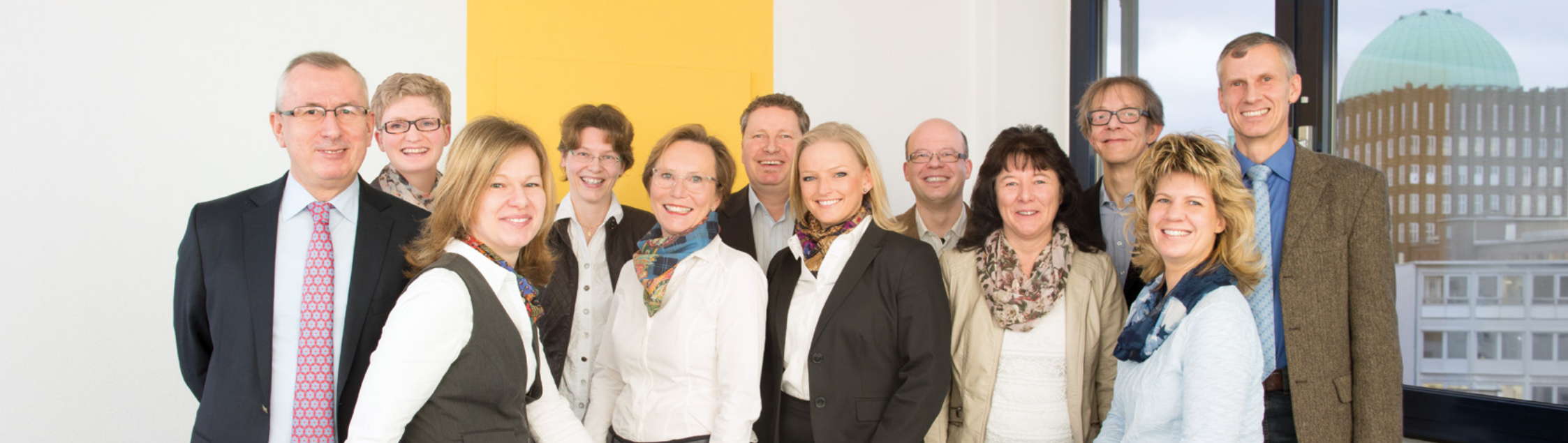
Ihr EFAS-Team vor Ort in Hannover